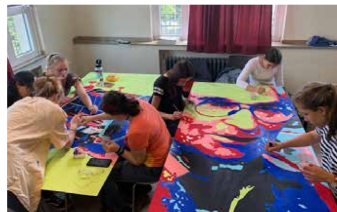
Schaffensprozess im Team