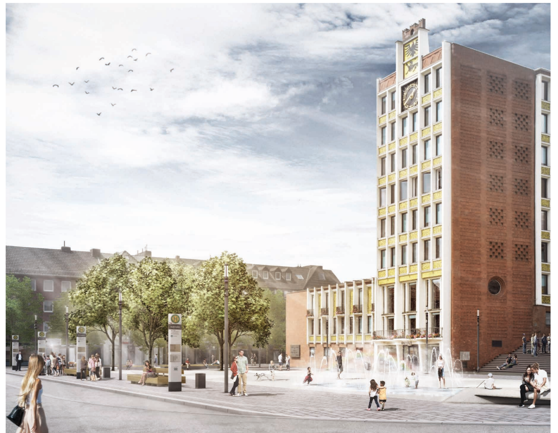
Der Kaiserplatz mit neuem „Gesicht“ - künftig laden Wasserspiel und Sitzflächen unter lichtem Baumschatten zum Verweilen ein (Visualisierung visuz, Berlin)