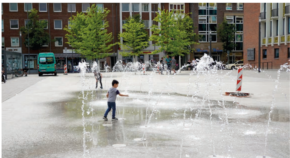
Wasserfontänen als Gestaltungselement und Spielort