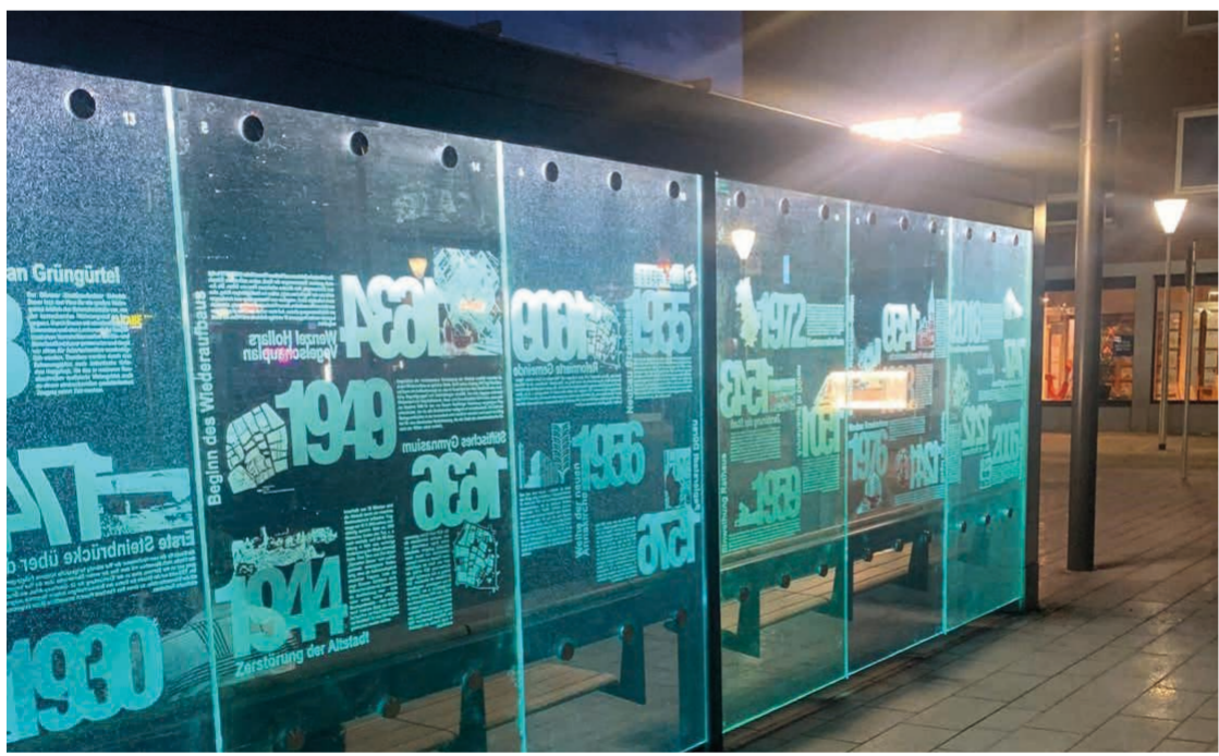
Abendliche Beleuchtung des Geschichtsmosaiks