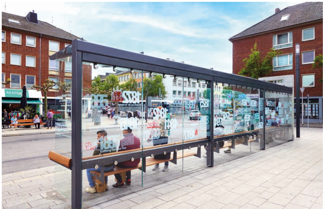
Neue Wartehalle mit Geschichtsmosaik