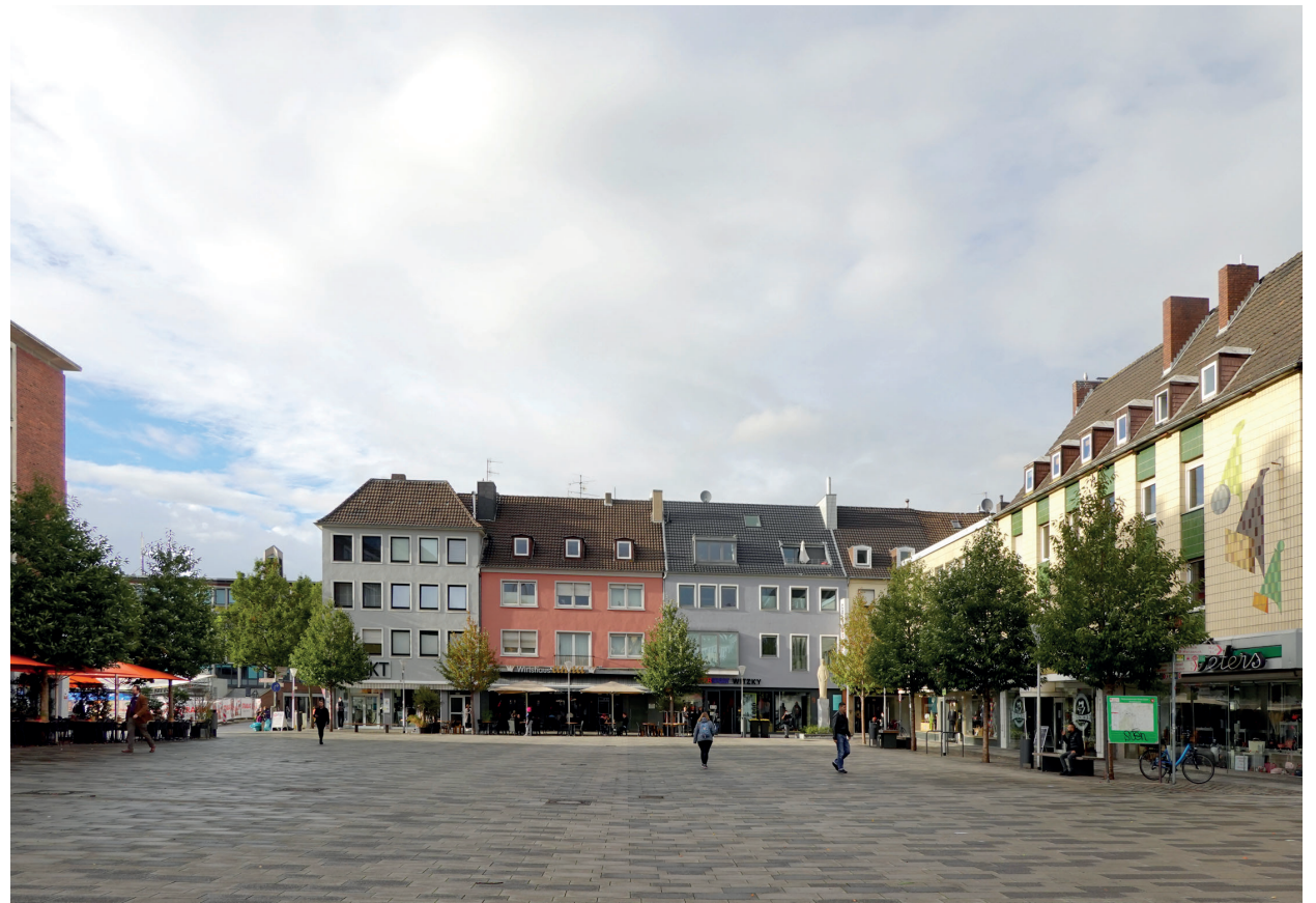
Der freie Marktplatz mit zeitgemäßem Ausstattungsband zwischen neuem Baumbestand