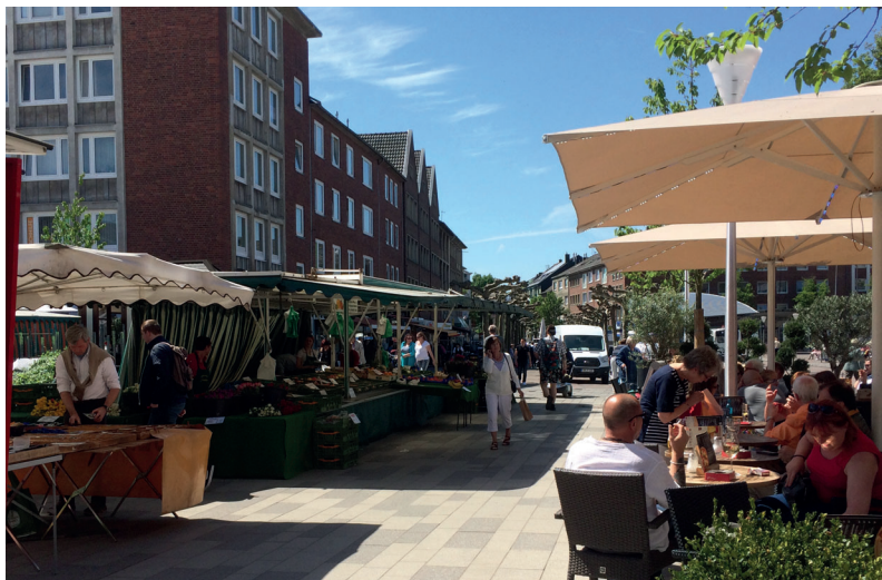
Außergastronomie und Markt ergänzen sich