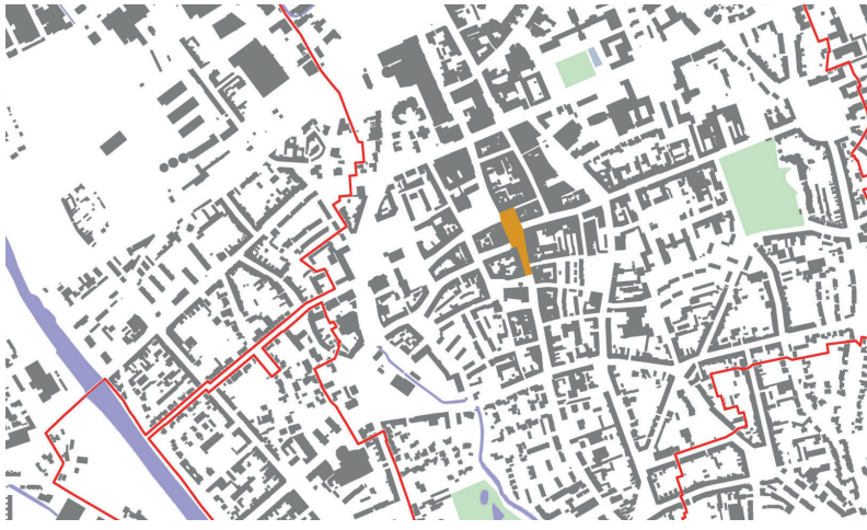
Übersichtsplan Innenstadt Düren