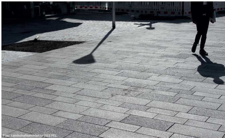
Neu gestaltete Pflasterfläche auf dem Marktplatz