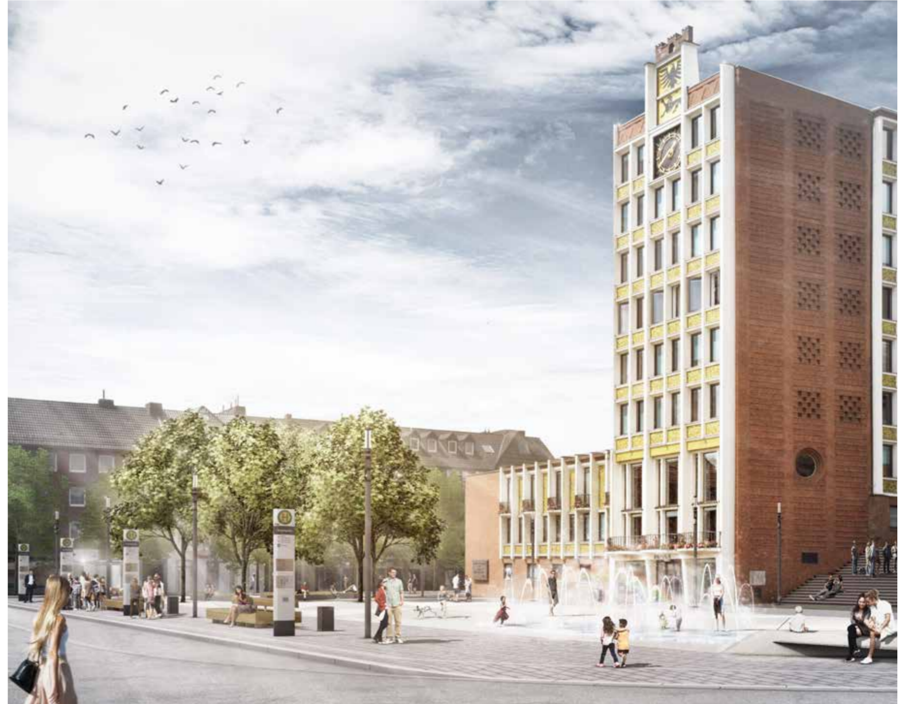
„Des Kaisers neue Kleider“ - künftig laden Wasserspiel und Sitzflächen unter lichtem Baumschatten zum Verweilen ein (Visualisierung visuz, Berlin)