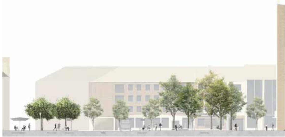
Querschnitt Süd-Nord (rechts das Rathaus)