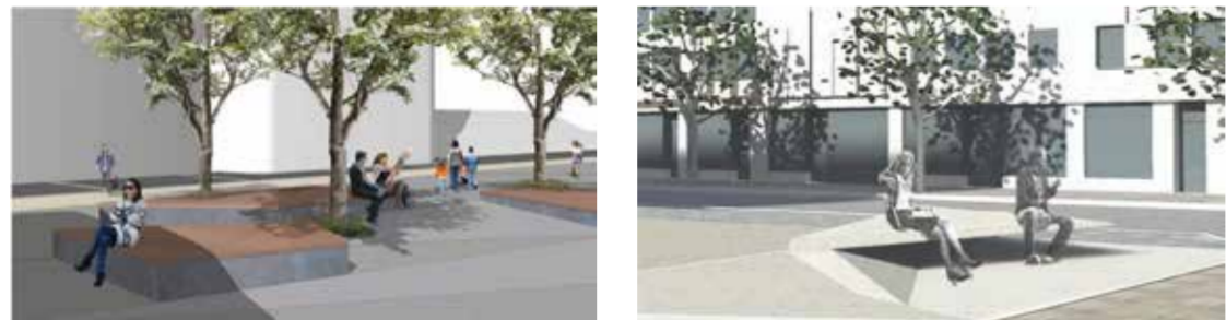
Einladende Sitzgelegenheiten unter Bäumen und am „gefalteten Eselohr“: Treffpunkt, Ort für die Pause und zum Beobachten