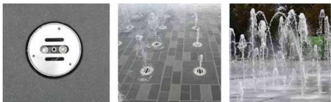
Wasserfontänen als Gestaltungselement und Spielort