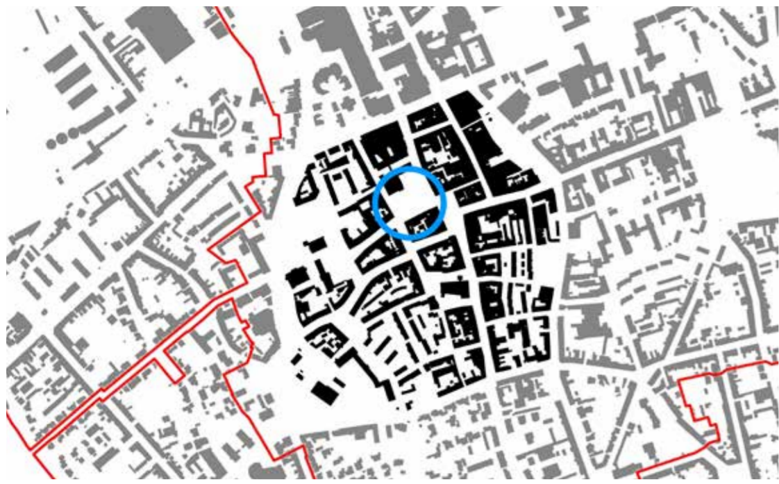
Übersichtsplan Innenstadt Düren