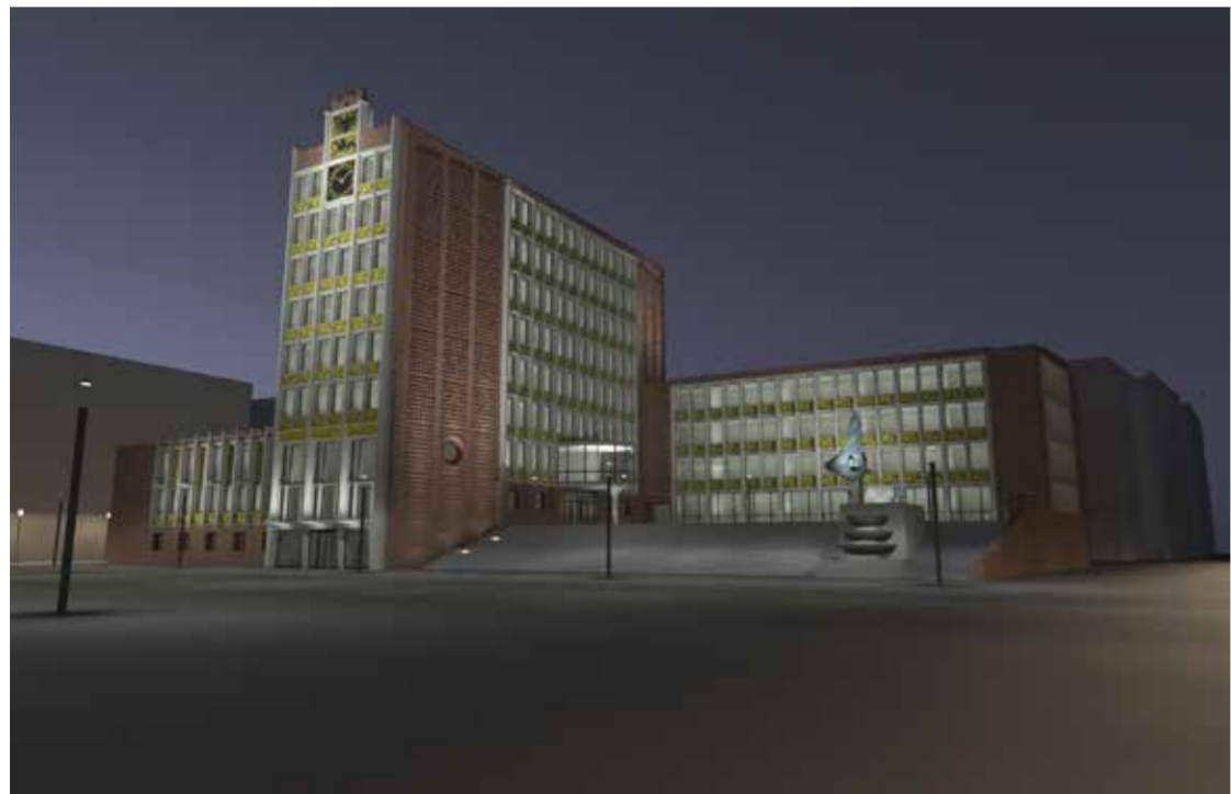
Das Rathaus in künftiger nächtlicher Beleuchtung