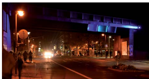
Probebeleuchtung am 05.11.2016: Bahnbrücken in der Josef-Schregel-Straße, Südseite