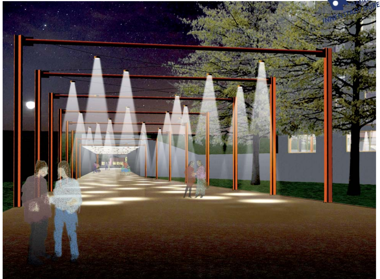
Geplante Fortführung der Beleuchtung an der Unterführung zum Haus der Stadt