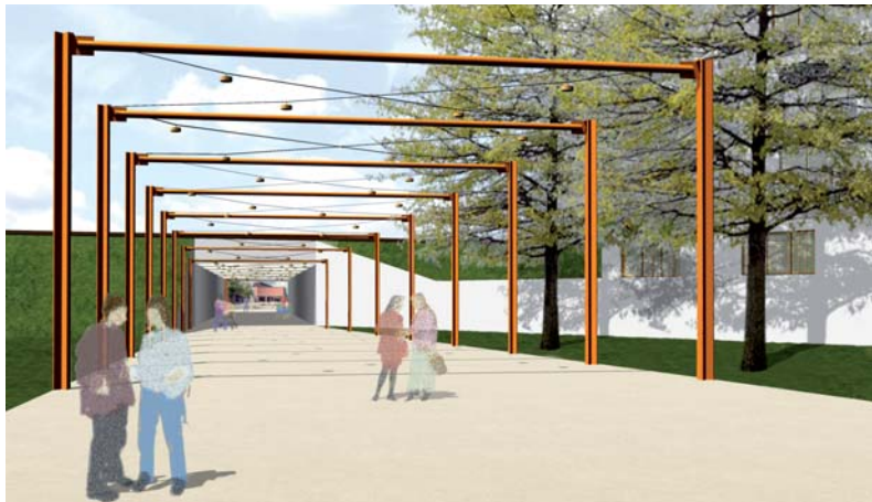
Tagvisualisierung Lichtportale, Unterführung zum Haus der Stadt