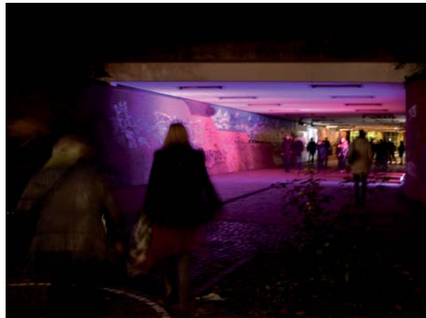
Probebeleuchtung am 05.11.2016: Unterführung zum Haus der Stadt