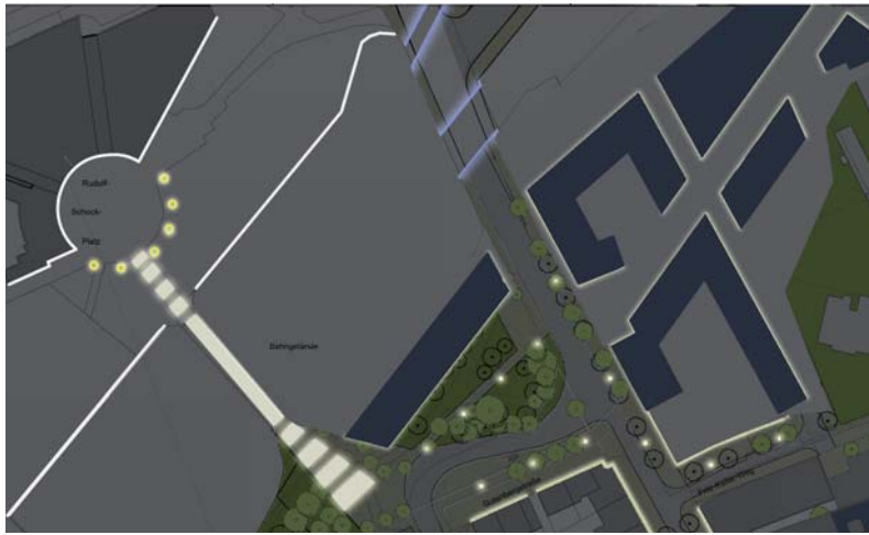
Lichtkonzept im Bereich Haus der Stadt und Bahnbrücken

Qualitätvolles Licht im öffentlichen Raum kann ein positives Bild der Stadt erzeugen und eine attraktive Atmosphäre schaffen, die auch abends zum Bummeln und Verweilen einlädt und somit allen Akteuren der Stadt nützt. In einem interdisziplinär und integriert angelegten Prozess wurde in Zusammenarbeit mit einem Lichtdesigner/Lichttechniker ein für Düren identitätsstiftendes Lichtkonzept erarbeitet und während einer beispielhaften Probebeleuchtung der Öffentlichkeit präsentiert. Schwerpunkte des Lichtkonzepts sind der Durchgang zum Haus der Stadt sowie die Bahnbrücken an der Josef-Schregel-Straße.