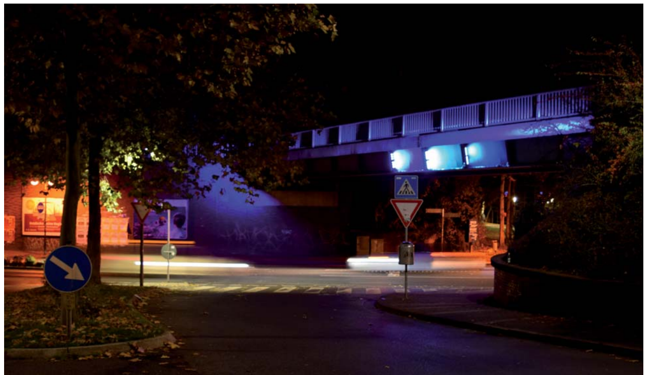
Probebeleuchtung am 05.11.2016: Bahnbrücken in der Josef-Schregel-Straße, Nordseite