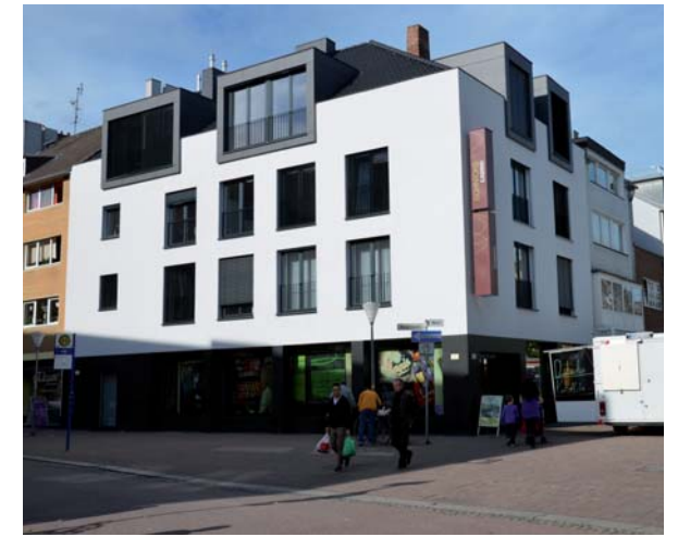
... nach der Modernisierung