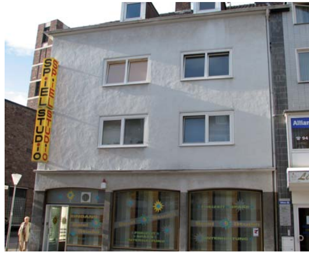
Vor und ...