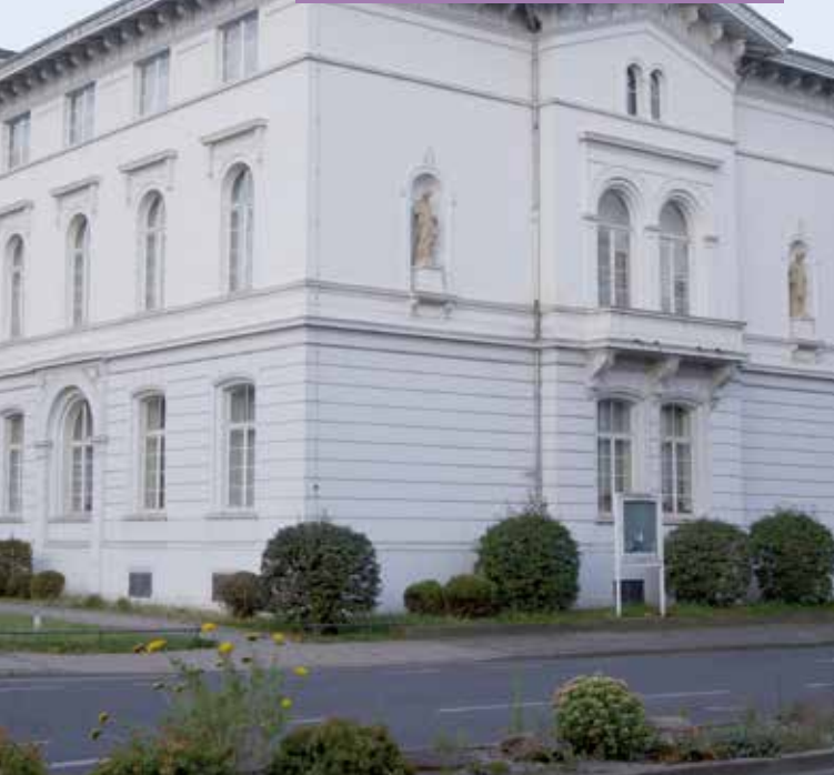
12.9. VILLEN & HERRENHÄUSER IN DÜREN