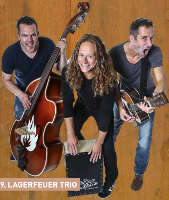
3.9. LAGERFEUER TRIO