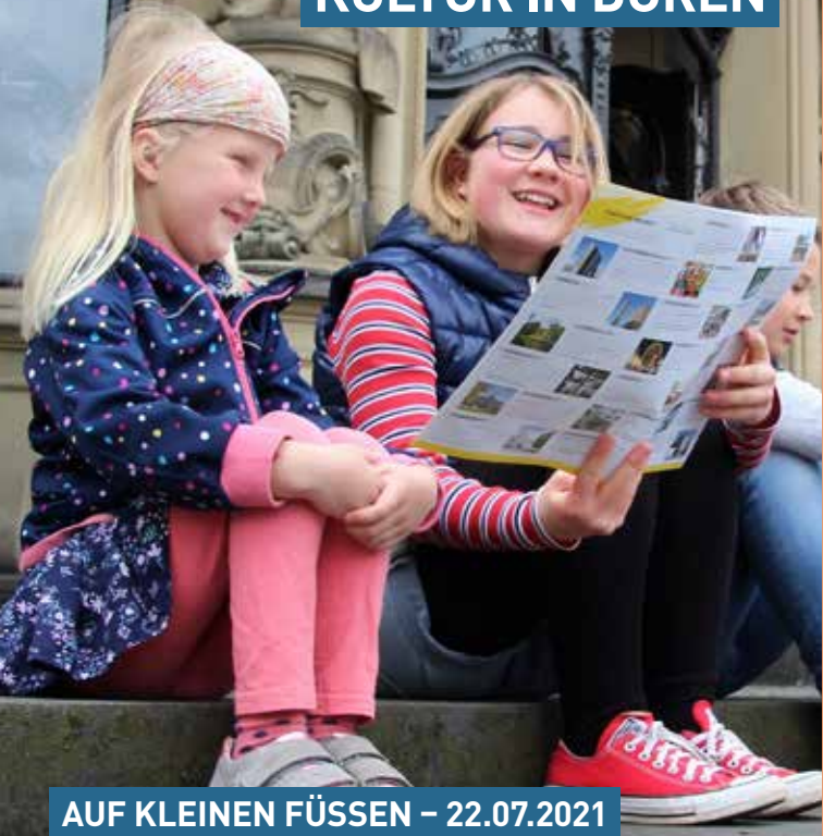
AUF KLEINEN FÜSSEN – 22.07.2021